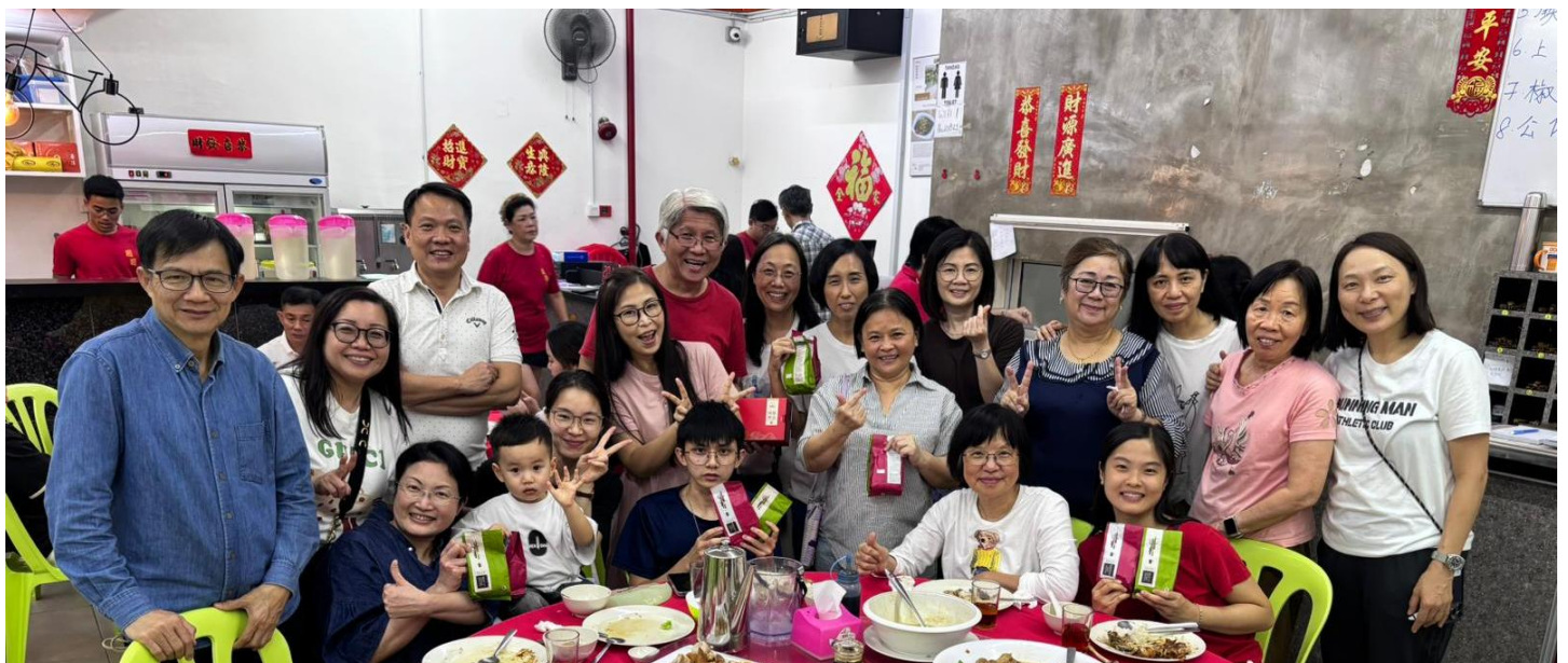
12月21日到忠主堂佈置及預備後 與西馬忠主堂同工、執委及事奉者晚飯