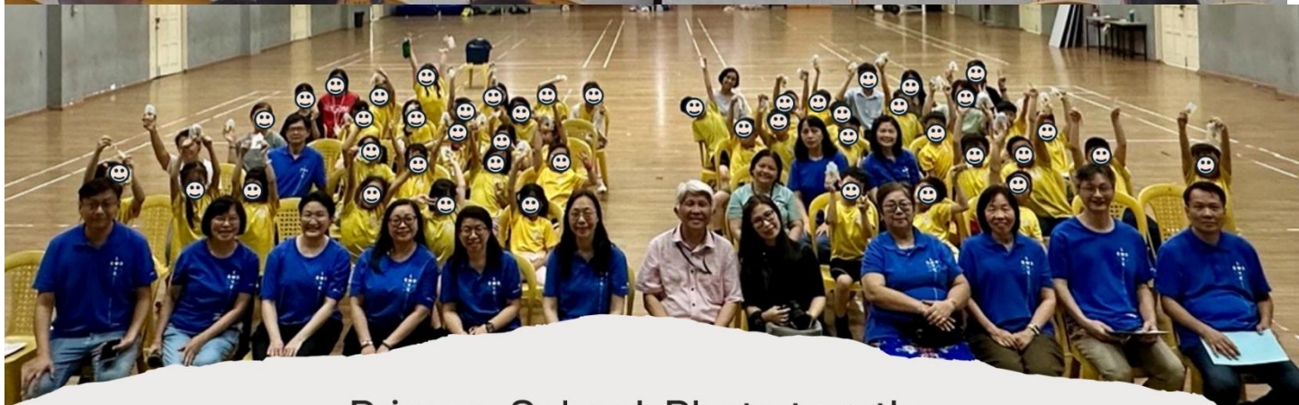
Primary School-Photo together