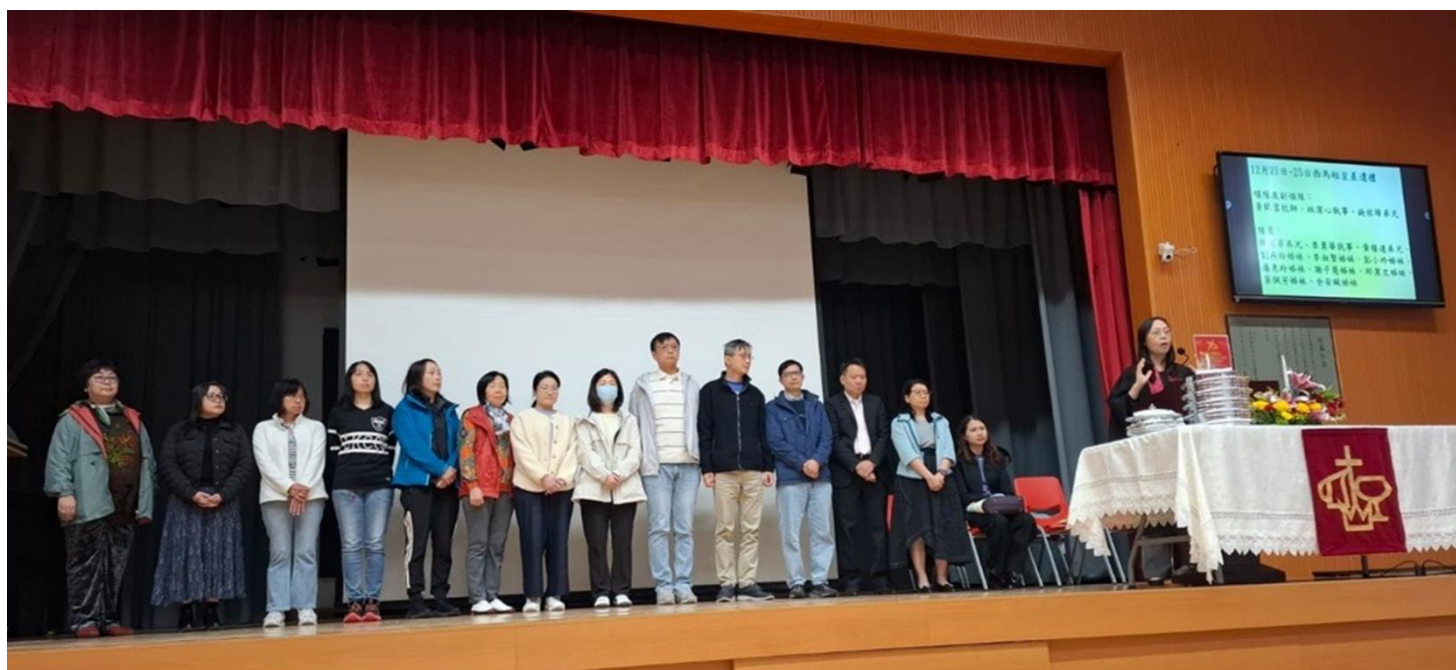
短宣隊預備前往作工，全教會後方禱告同行！